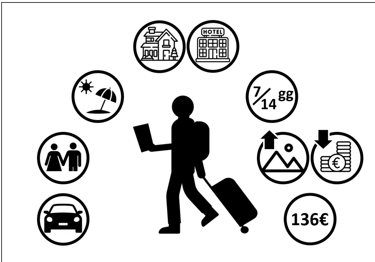
Grafico 1 –L'Identikit del turista medio in vacanza in Liguria

Il turista risulta mediamente soddisfatto del soggiorno trascorso in vacanza, restando particolarmente colpito dalle bellezze ambientali e dal paesaggio che offre la Liguria. L'aspetto che ha soddisfatto di meno l'ospite nazionale è stato il costo complessivo del soggiorno, considerando che la spesa media per ogni giorno di vacanza ha sfiorato 136,00 euro.